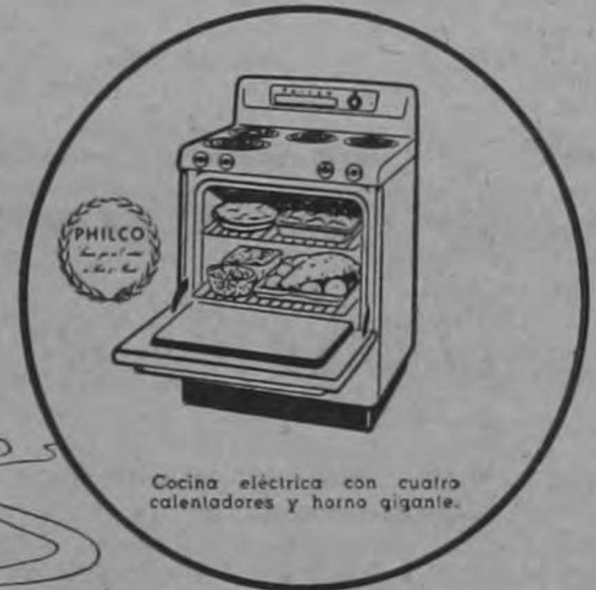
Cocina eléctrica con cuatro calentadores y horno gigante.