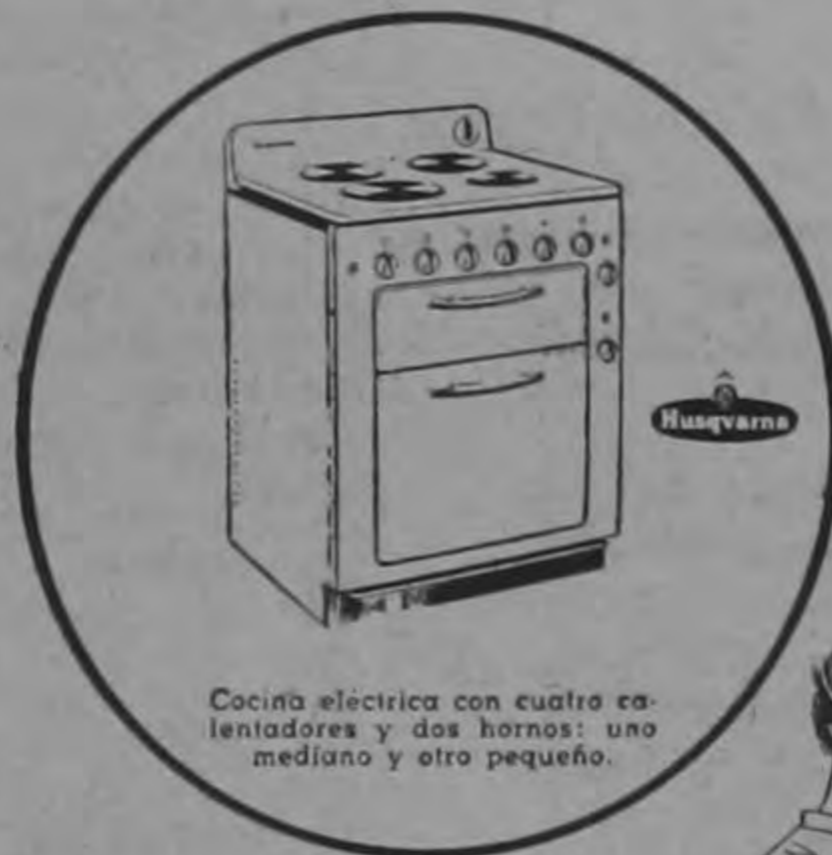
Cocina eléctrica con cuatro calentadores y dos hornos: uno mediano y otro pequeño.