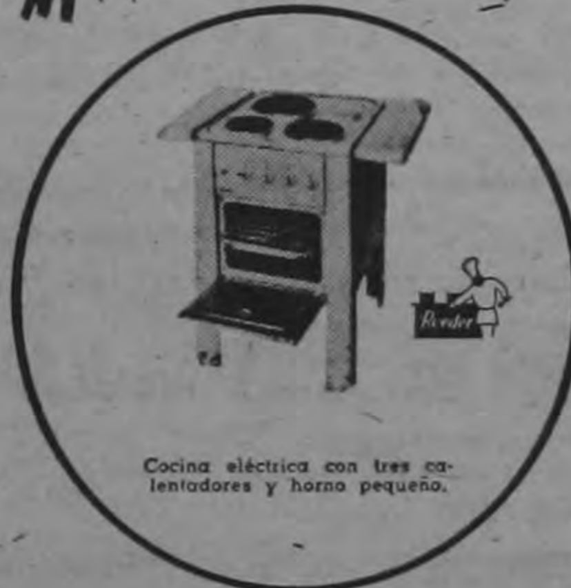
Cocina eléctrica con tres calentadores y horno pequeño.