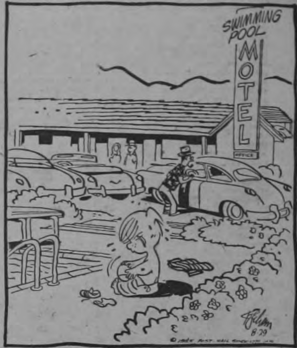
—¿Vámonos, de aquí este hotel es muy caro?